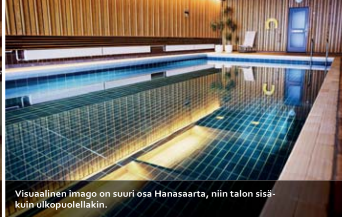
Visuaalinen imago on suuri osa Hanasaarta, niin talon sisä- kuin ulkopuolellakin.