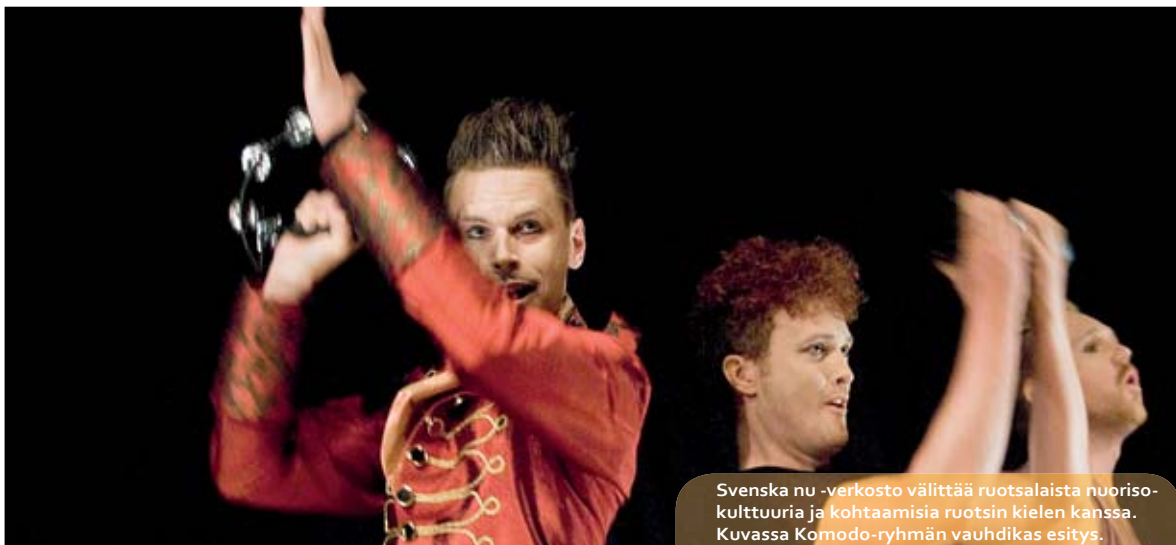
Svenska nu -verkosto välittää ruotsalaista nuorisokulttuuria ja kohtaamisia ruotsin kielen kanssa. Kuvassa Komodo-ryhmän vauhdikas esitys.