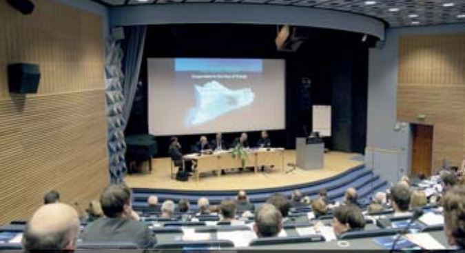
Ajankohtaisia kysymyksiä käsitellään niin kursseilla ja seminaareissa kuin kansainvälisissä konferensseissakin.