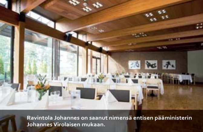
Ravintola Johannes on saanut nimensä entisen pääministerin Johannes Virolaisen mukaan.